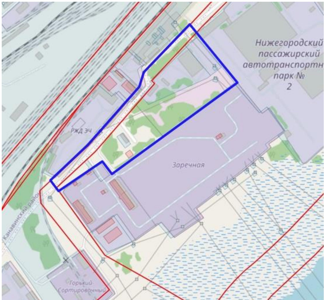
Схема границ подготовки документации по планировке территории